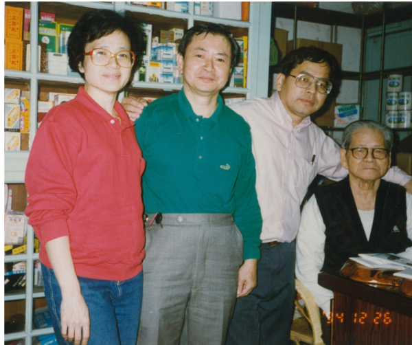
國亮與爸爸及大哥大嫂