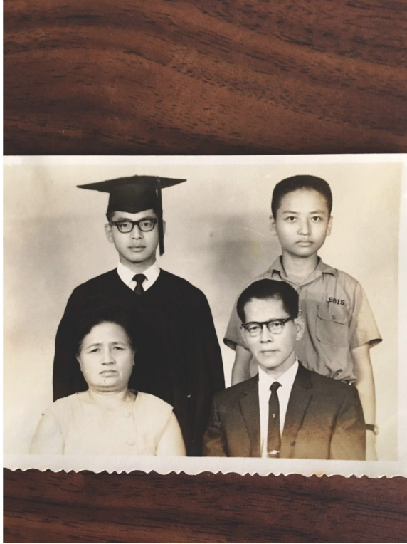
國亮與父母及弟弟