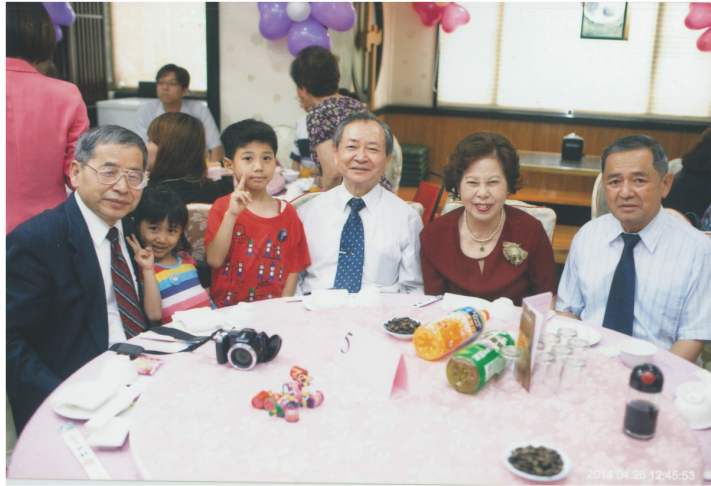
四哥 大哥 二哥夫婦 2014年

然而卻於去年（2021年）10月間其去逝惡耗，令人痛惜，我們失去了一位可愛的四弟及英才！但是我們以四弟為榮！！賢慧的弟媳素梅也辛苦您了！希望大家節哀保重繼續向前行！