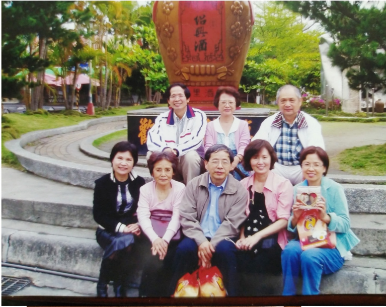
2007年 埔里表兄弟姊妹