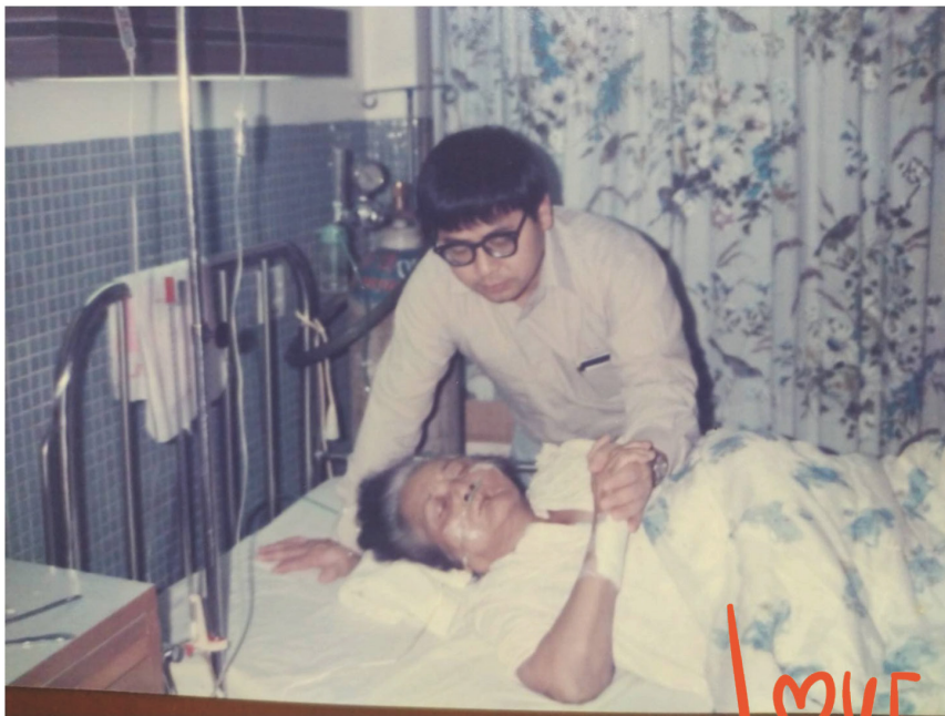
國亮回國照顧母親