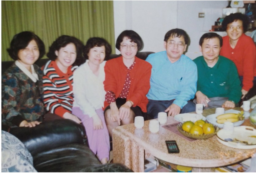
國亮在右三 大哥夫婦在右邊